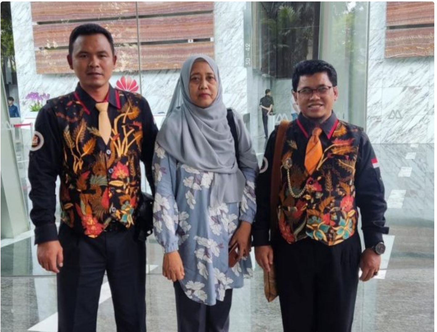
Foto: Tim LIDIK KRIMSUS RI melaporkan dugaan penyimpangan ini ke Komisi Pemberantasan Korupsi (KPK) dan Otoritas Jasa Keuangan (OJK), menuding adanya praktik kotor yang dilakukan oknum PT. Bank Negara Indonesia (Persero) Tbk di Kota Semarang. Senin (04/11/2024).

JAKARTA- Tim Divisi Hukum Lembaga Informasi Data Investigasi Korupsi dan