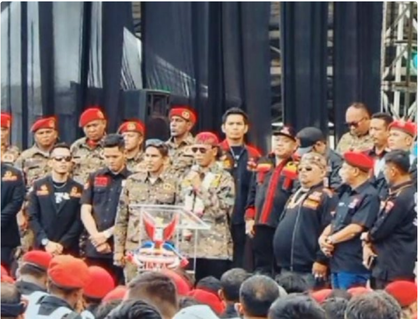
Foto: Saat Puluhan Ribu Anggota Gerakan Rakyat Indonesia Bersatu Jaya (GRIB Jaya) Membanjiri Gedung DPR-MPR RI Untuk Memastikan Kelancaran Acara Pelantikan Presiden Prabowo Subianto dan Wakil Presiden Gibran Rakabuming Raka. Minggu (20/10/2024).

JAKARTA - Dalam momen bersejarah pelantikan Presiden Prabowo Subianto dan