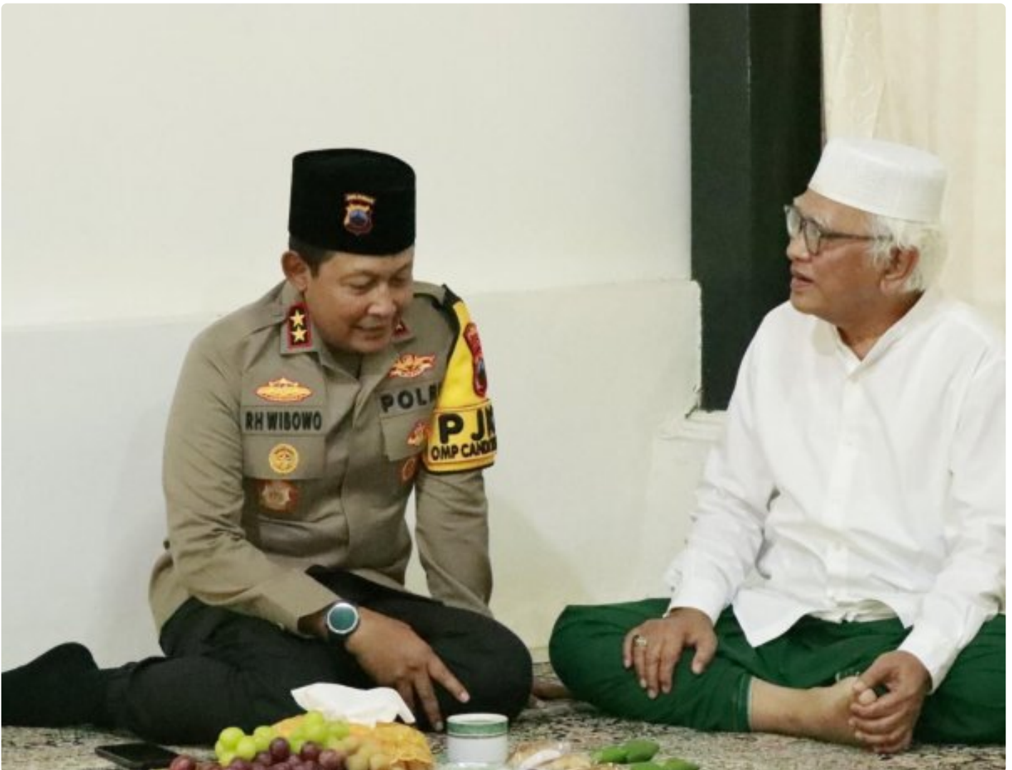
Foto: Kapolda Jawa Tengah, Irjen Pol Ribut Hari Wibowo, melakukan kunjungan silaturahmi ke sejumlah tokoh agama terkemuka di Kabupaten Rembang pada kesempatan menjelang Pilkada 2024. Senin (21/10/2024).

REMBANG - Dalam suasana hangat dan penuh kekeluargaan, Kapolda Jawa Tengah Irjen Pol Ribut Hari Wibowo mengunjungi sejumlah tokoh agama